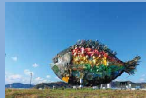
宇野のチヌ / 淀川テクニク

瀬戸内海の島々への定期航路やクルーズ客船の寄港地でもあり、瀬戸内国際芸術祭アート作品「宇野のチヌ」(淀川テクニク)をはじめとした、様々なパブリックアートがちりばめられた宇野港は、瀬戸内の魅力を堪能するための玄関であり、旅の起点でもあります。ここから始まる旅の一步はきっと忘れられない特別な時間に誘ってくれることでしょう。レンタサイクルで周辺を散策したり、海沿いのサイクリングを楽しんだりすることもできます。