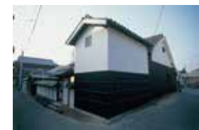
家プロジェクト「角屋」

直島の本村地区において現在7軒公開されているアートプロジェクトで、点在していた空き家などを改修し、空間そのものを作品化しています。