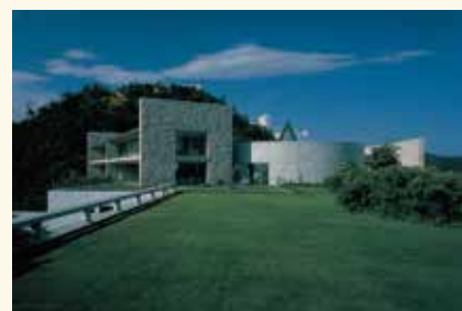
ベネッセハウス

「自然・建築・アートの共生」をコンセプトに、美術館とホテルが一体となった施設です。建築は安藤忠雄による設計で、館内外のいたるところにアートが点在しています。