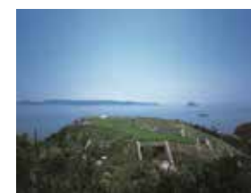
地中美術館 写真：藤塚光政

「自然と人間を考える場所」として建設された館内では、クロード・モネ、ジェームズ・タレル、ウォルター・デ・マリアの作品が鑑賞できます。