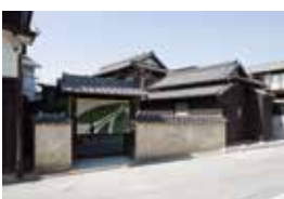
ANDO MUSEUM

過去と現在、木とコンクリート、光と闇。対立した要素が重なり合う安藤忠雄の建築要素が凝縮された空間を鑑賞することができます。