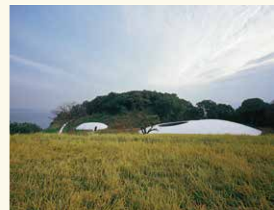
豊島美術館

棚田プロジェクト敷地の一角にある、水滴のような形をした美術館。自然と建物が呼応する有機的な空間は、ここに訪れる人の心を魅了し続けています。