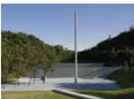
李禹煥美術館

ヨーロッパに活動の拠点を置くアーティスト、李禹煥の絵画と彫刻作品を安藤忠雄の手掛けた建築の中で鑑賞することができます。