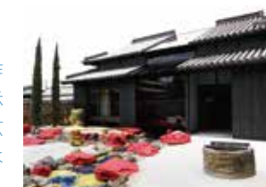
豊島横尾館

アーティスト・横尾忠則の作品を古い民家を改修した展示空間で鑑賞できます。豊島の玄関口で出迎えてくれる作品は圧巻です。